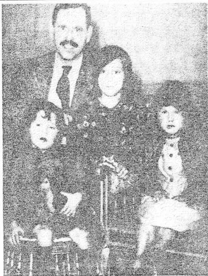
Nur von vier Mitgliedern der Familie, die in Auschwitz ermordet wurde, existiert dieses Foto.